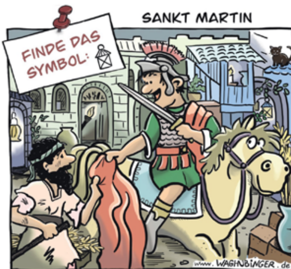
Lösung: Die Laterne ist rechts im Torbogen unter der Katze

Doch auch ihr könnt Menschen helfen, die in Not sind. Ihr könnt mit denen teilen, die weniger haben als ihr. Ihr könnt euer Schulbrot teilen mit dem, der seines vergessen hat. Ihr könnt euer Wissen teilen mit denen, die es schwerer in der Schule haben. Es gibt ganz viele Möglichkeiten, ein Martin zu sein.